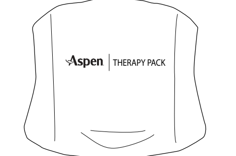
ASPEN® THERAPY PACK